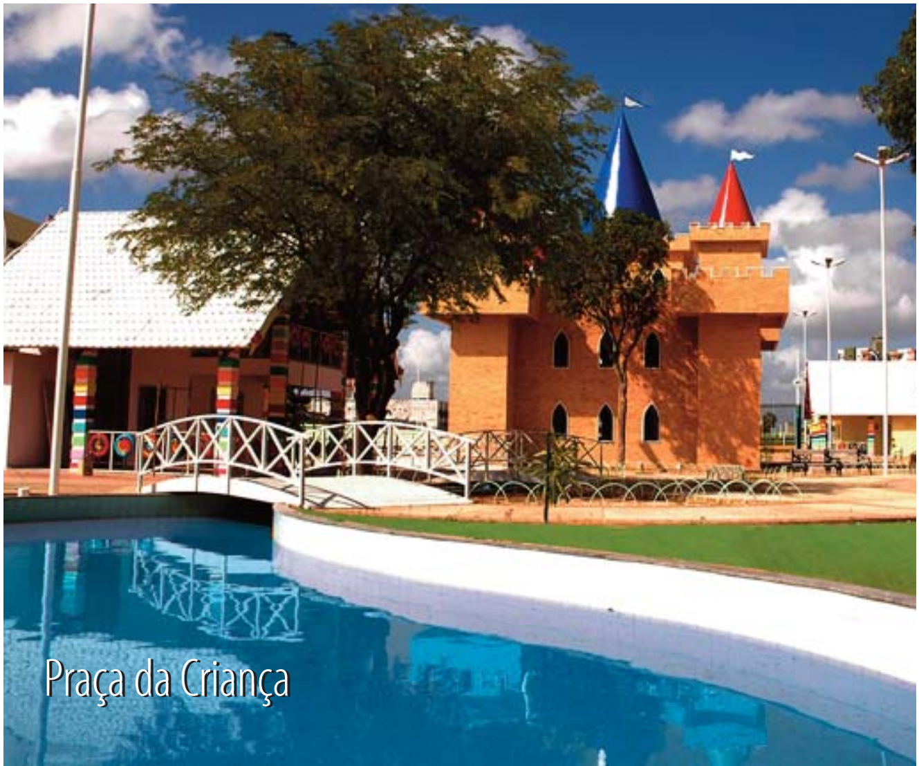
Praça da Criança